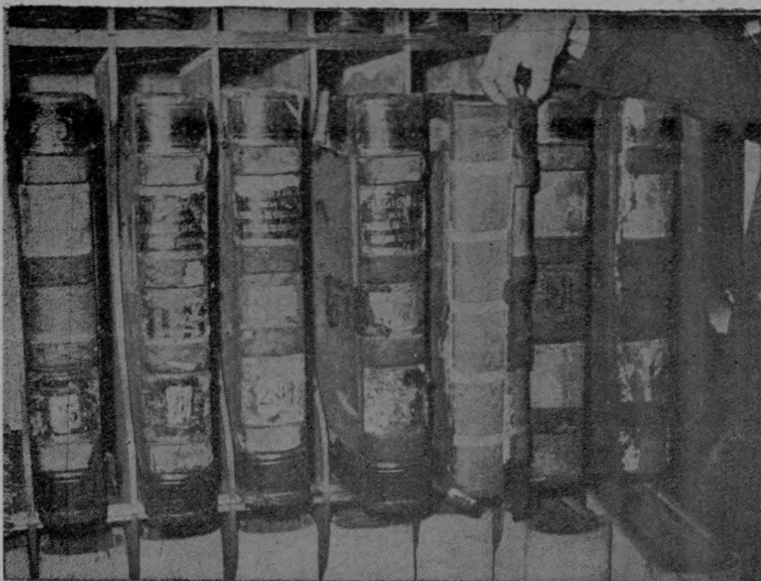
Dos volúmenes, que datan de 1867, han sido semidestrozados por las polillas. Nótese el estado de deterioro en que se encuentran. Esto ocurre en el Registro de la Propiedad.

Esa información surtió el efecto que deseábamos. Ayer mismo, es decir, al día siguiente de esa información, un Delegado del Ministerio de Salubridad Pública se presentó al citado Registro y examinó personalmente los libros que han sido atacados por la polilla. Con ello podemos decir, que el problema desaparecerá, ya que de inmediato se procederá a la fumigación del caso, para terminar con el daño que día con día se acrecentaba más. Nos satisface saber que nuestras informaciones merecen atención especial de las altas dependencias del Gobierno. Ojalá así ocurriese siempre.