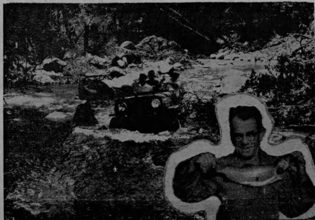
Un "paso" del río Coto Brus, paraíso de los pescadores de truchas, que describe el periodista Mo Nally. El "yip" en media corriente. Una de las truchas del Coto

lunes, en el transcurso de un debate apasionado, y al calor de las "barras", el Directorio de la Asamblea Legislativa ha creído oportuno consultar al Ministerio de Seguridad, respecto al envío de piquetes de la Fuerza Pública, a efecto de que mantengan el orden y velen por la seguridad de las personas.